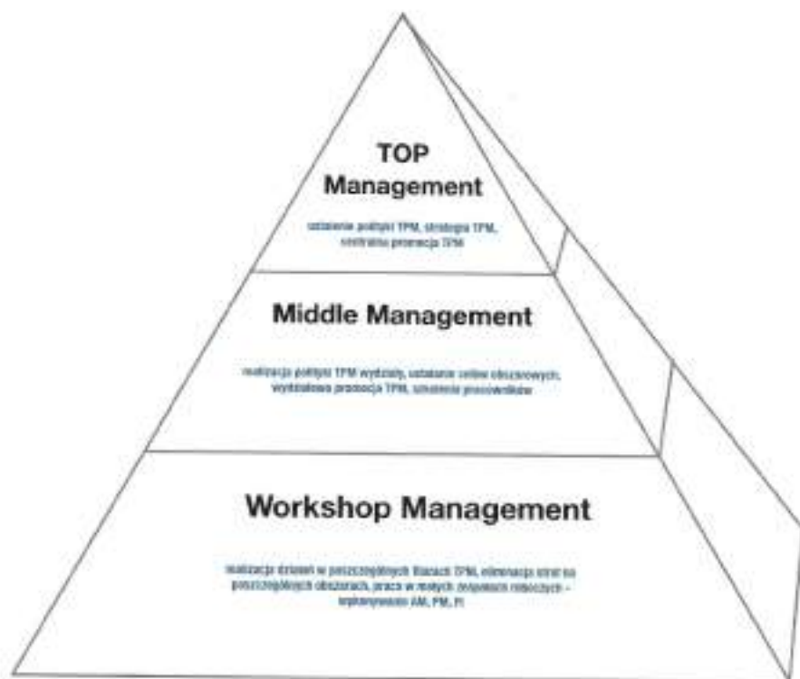
Rys. 1. Struktura promocji TPM w przedsiębiorstwie

Taka struktura przedsiębiorstwa idealnie wpasowuje się w promocję systemu TPM poprzez przypisanie odpowiednich zadań na każdym ze szczebli struktury.